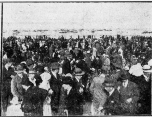
Fra venstre: Landmaskinerne defilerer forbi Administrationsbygningen, Erlinds Møskine efter Nedstigningen og Folkemængden mellem Administrationsbygningen og Strandbredden.