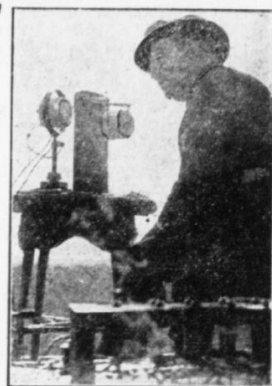
Speakeren ved Højttalerne.